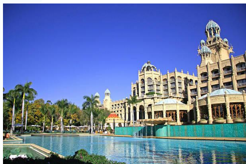
Fourways et le Montecasino.

L'Indaba Hotel & Conference Centre dispose d'un service de navette pour rejoindre le centre commercial de