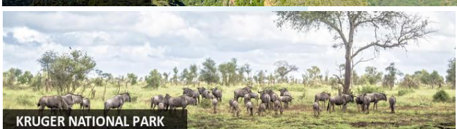
KRUGER NATIONAL PARK