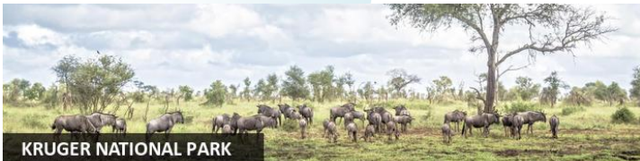
KRUGER NATIONAL PARK