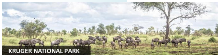
KRUGER NATIONAL PARK