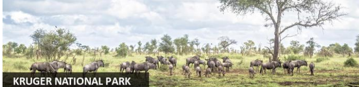
KRUGER NATIONAL PARK