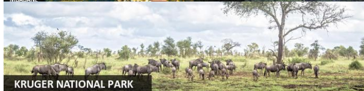
KRUGER NATIONAL PARK