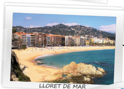
LLORET DE MAR