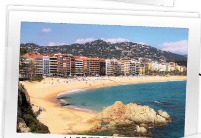
LLORET DE MAR