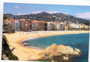
LLORET DE MAR