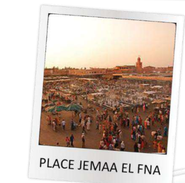
PLACE JEMAA EL FNA