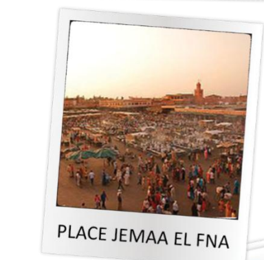
PLACE JEMAA EL FNA