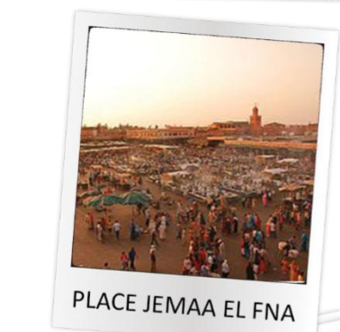
PLACE JEMAA EL FNA