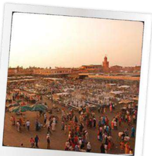
PLACE JEMAA EL FNA