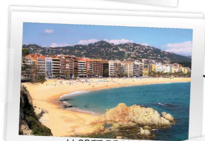
LLORET DE MAR