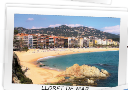
LLORET DE MAR